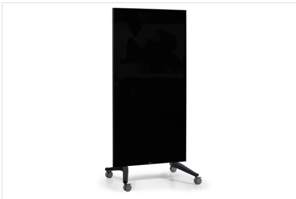
Tableau en verre mobile